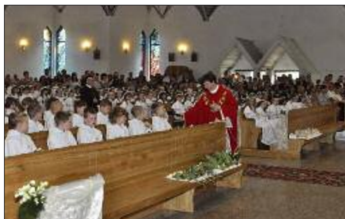
Uroczystości pierwszokomunijne w kościele