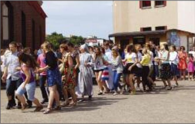
Wspólny taniec przed kościołem