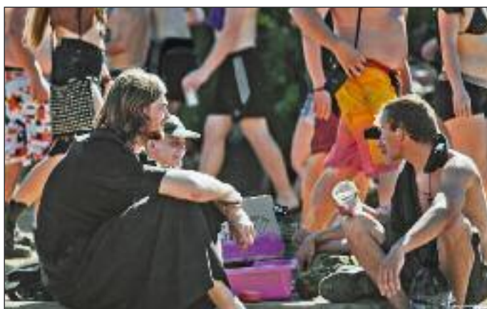
Domowy Kościół w plenerze