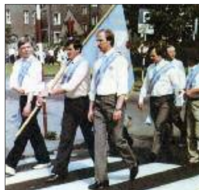
Przemarsz ze sztandarami Bractwa Oblatów św. Brygidy na ulicach Gdańska

Bractwo rozrastało się liczebnie, organizowano szkolenia, podejmowano różnorodne akcje, w tym podejmowano dyżury przy grobie ks. Jerzego Popiełuszki, organizowano pielgrzymki na Jasną Górę i do Piekar Śląskich. W odpowiedzi na apel Episkopatu Polski, dotyczący wstrzymania się od spożywania napojów alkoholowych w miesiącu sierpniu, członkowie Bractwa pikietowali sklepy monopolowe. W czerwcu 1984 r., w święto Bożego Ciała, Bractwo Oblatów św. Brygidy po raz pierwszy zaprezentowało się publicznie w procesji i pierwszy raz ze sztandarem.