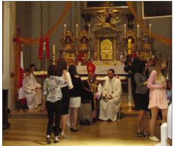
Bierzmowanie w Polskiej Misji Katolickiej we Wiedniu