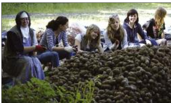
Dzień skupienia D.A. u sióstr benedyktynek w Żarnowcu