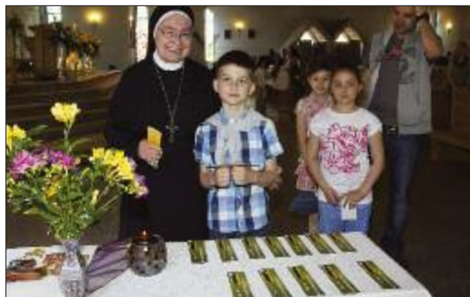
Pierwsza spowiedź dzieci przystępujących do I Komunii św.