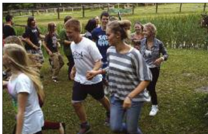
Agapę bierzmowanej młodzieży w Gołębiewie