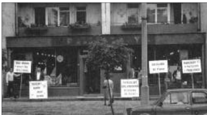
Członkowie Bractwa pikietują przed sklepami z alkoholem