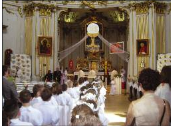
I Komunia Św. w Polskiej Misji Katolickiej we Wiedniu

Maj jest miesiącem poświęconym Maryi, który w każdym kościele katolickim w Austrii rozpoczyna w pierwszą sobotę uroczysta Msza Św. zakończona procesją ze świecami z prezbiterium do ołtarza NMP, po której następuje wspólna agapa w kaplicy lub salce parafialnej. W tym roku członkowie Ruchu Odnowy w Duchu Świętym zorganizowali następnego dnia także katechezę ewangelizacyjną. Na ogromnej łące w Parku Naddunajskim, tuż obok krzyża upamiętniającego spotkanie bł. Jana Pawła II z młodymi wiedeńczykami podczas jego pielgrzymki do Austrii, spotkały się rodziny katolickie z wielu różnych krajów świata, by w to niedzielne, słoneczne popołudnie wspólnie wyznawać swoją wiarę tańcem i śpiewem przy dźwiękach południowoamerykańskiej muzyki religijnej granej na żywo. Chętni mogli tam także skorzystać ze spowiedzi. Wśród uczestników spotkania było wielu świeckich i duchownych z Polski.