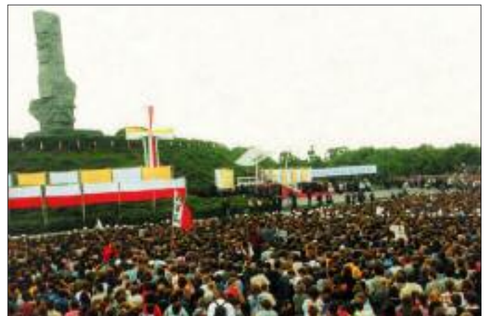
Spotkania modlitewne Ojca Świętego w Gdyni i na Westerplatte

Wielu z tych, którzy byli na Zaspie z Ojcem Świętym 12 czerwca 1987 roku, prawdopodobnie do dziś zastanawia się, czy okręt, z którego Jan Paweł II głosił tak ważne z tego przesłanie? Jednak wówczas, w czerwcu 1987 roku, III pielgrzymka Ojca Świętego podniosła nas z kolan i przywróciła nadzieję.