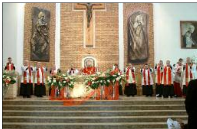
Uroczystość bierzmowania przed świątynią i we wnętrzu