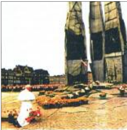
Samotna modlitwa Ojca Świętego przed pomnikiem Poległych Stoczniovców '70 roku.

W południe Papież spotkał się z chorymi w bazylice Mariackiej w Gdańsku a następnie udał się pod pomnik Poległych Stoczniovców, gdzie modlił się w samotności. Obrzeża placu Trzech Krzyży wypełnione były funkcjonariuszami SB odwróconymi plecami do modlącego w całkowitym milczeniu Jana Pawła II i odgradzającymi Go w ten sposób od rzeszy wiernych. „W takim miejscu milczenie jest krzykiem” – mówił potem Papież wyraźnie wzruszony.