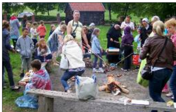
Wyjazd dzieci pierwszokomunijnych do Gietrzwałdu