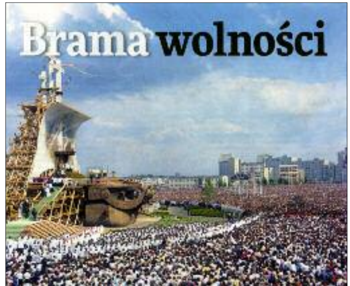
Historyczne zdjęcie zamieszczone w Gościu Niedzielnym 10 czerwca 2012 r.

W homilii Papież zacytował słowa Apostoła: „«Jeden drugiego brzemiona noście» – to zwięzłe zdanie Apostoła jest inspiracją dla międzyludzkiej i społecznej solidarności. Solidarność – to znaczy: jeden i drugi, a skoro brzemie, to brzemie niesione razem, we wspólnocie. A więc nigdy: jeden przeciw drugiemu. Jedni przeciw drugim.”.