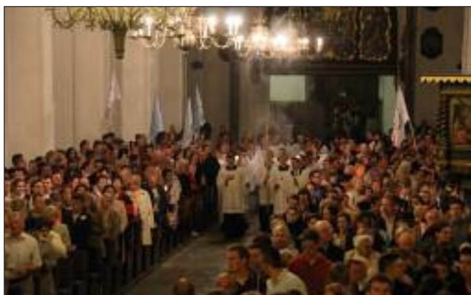
Modlitewne czuwanie w bazylice Mariackiej w Gdańsku przed świętym Zesłania Ducha Świętego