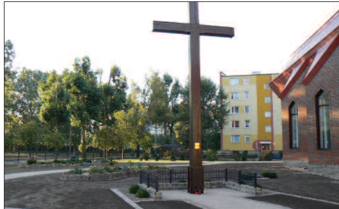
Przeniesienie po konserwacji Krzyża misyjnego jesienią 2007 roku