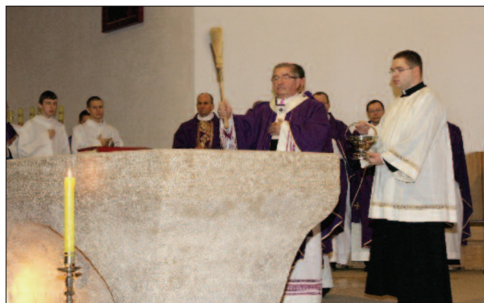
Ks. abp Sławoj Leszek Głódź poświęcił nowy ołtarz podczas uroczystej Eucharystii, 14 XII 2008 r.