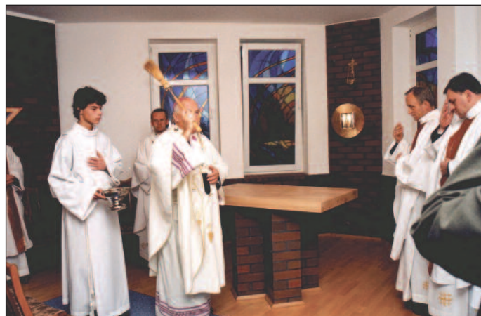
Ks. abp Tadeusz Gołowski święci w klasztorze kaplicę Chrystusa Króla, 15 XI 2003 r.