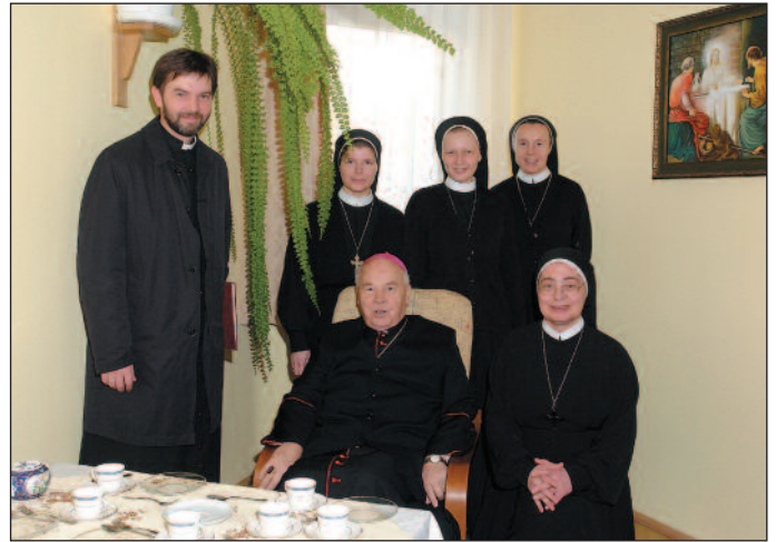
U sióstr betanek. Ks. abp Tadeusz Gocłowski i ks. Proboszcz z wizytą duszpasterską podczas wizytacji kanonicznej w grudniu 2006 roku.

Zgromadzenie Sióstr Rodziny Betańskiej zostało powołane do pomocy kapłanom w pracach parafialnych. W sposób szczególny siostry modlą się za kapłanów oraz otaczają ich duchową opieką. Żyjąc duchem św. Franciszka kształtują w swoich sercach i wspólnotach ducha modlitwy oraz kontemplacji. Wpatrując się w pełnię życia Niepokalanej i Jej bezgraniczne poświęcenie Bogu uczą się od Niej czystości, posłuszeństwa, ubóstwa, pokory i służby drugiemu człowiekowi. Oddając całkowicie swoje życie Panu Bogu i Kościołowi siostry pragną dążyć do upodobnienia się do swego Oblubieńca cichego i pokornego. Pragną dorastać do pełni miłości w Chrystusie zapatrując się na ideał życia rodziny z Betanii: Marii, Marty i Łazarza – przyjaciół Jezusa. I jakże cieszą się, że mogą tutaj posługiwać i działać wpisując się w Jubileusz 25 lecia naszej parafii!