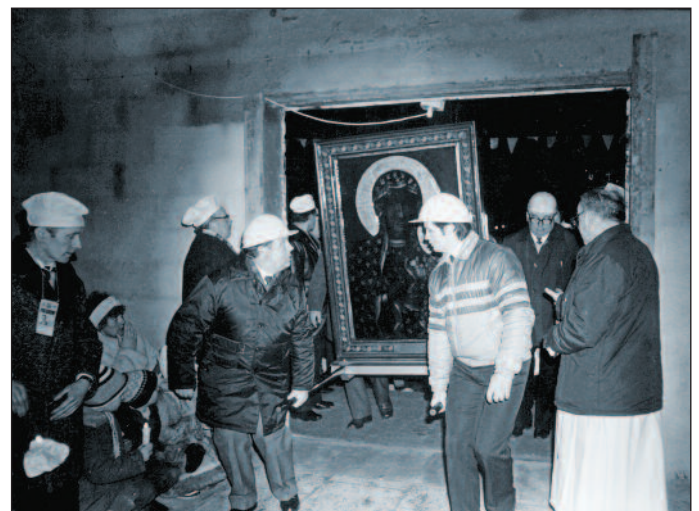
Nawiedzenie kopii obrazu Matki Bożej Częstochowskiej w nowo wybudowanej kaplicy