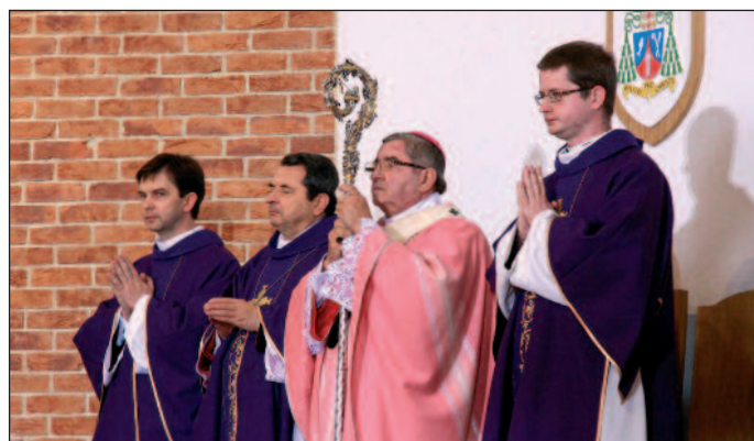
Poświęcenie Krzyża w prezbiterium. 11 XII 2011 r. Mszę św. celebryje ks. abp Sławoj Leszek Głódź