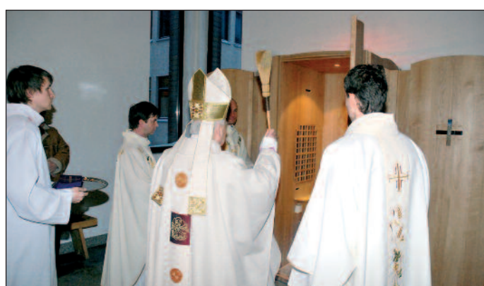
Ks. abp Tadeusz Gocłowski poświęcił nowe konfesjonały 10 I 2010 r.