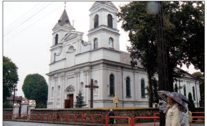
Suchowola. Kościół parafialny pw. św. Apostołów Piotra i Pawła