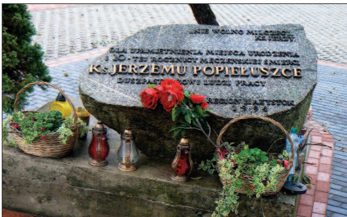
Okopy. Głaz z płytą pamiątkową