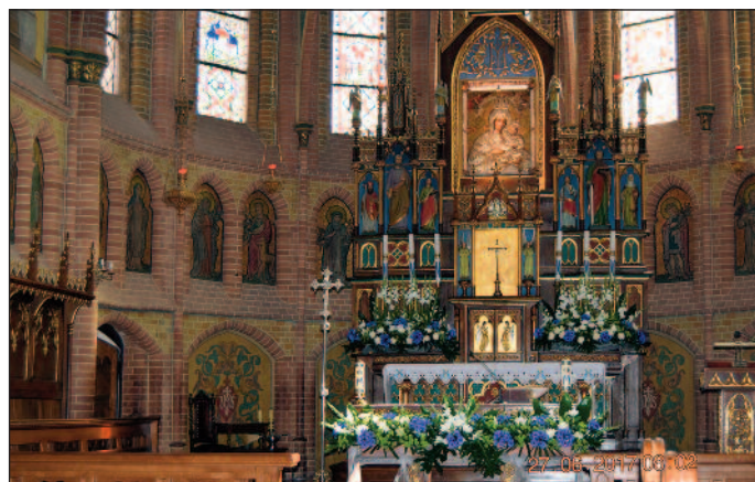
27 czerwca 2017 r. pielgrzymujący chórzyści razem z ks. Proboszczem, odwiedzili Gietrzwałd w 140. rocznicę pierwszego dnia objawienia.