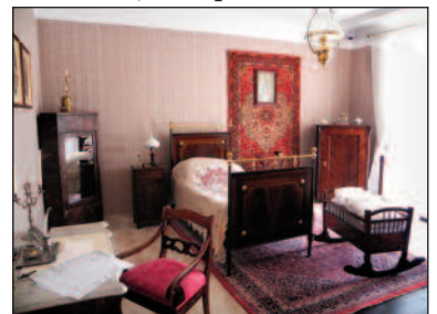
Rekonstrukcja wnętrza pokoju rodziny Chmielowskich z połowy XIX wieku