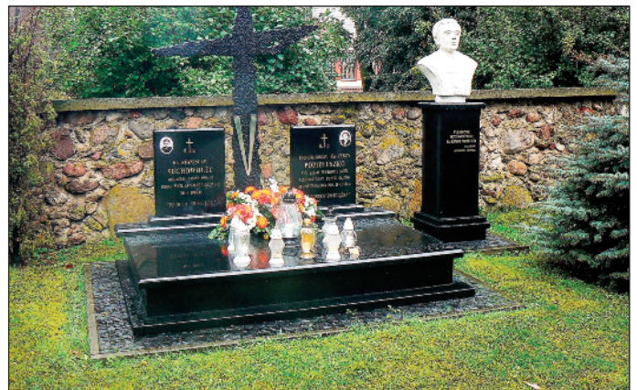
Suchowola. Symboliczny grób ks. Jerzego i ks. Stanisława Suchowolca