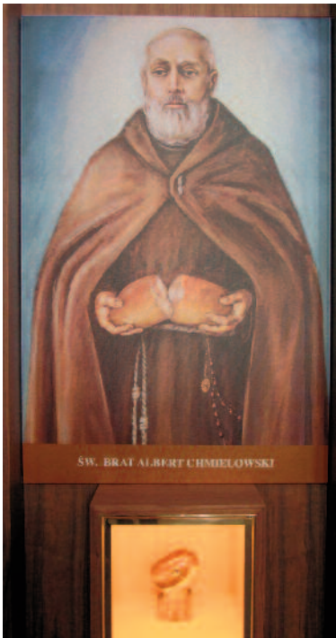
relikwie Św. Brata Alberta

O wielkości patrona naszej parafii świadczy fakt, iż zajmuje on już swoje miejsce w narodowym panteonie świętych polskich w warszawskiej świątyni Opatrzności Bożej. Kościół ten jest jeszcze właściwie nadal w budowie, ale relikwie naszych największych świętych zostały umieszczone w nim jako pierwsze. Te św. Brata Alberta znajdują się oczywiście w charakterystycznej symbolicznej dłoni z bochenkiem chleba, w górnym kościele, obok innych wybitnych świętych duchownych polskich (np. o. Maksymiliana Marii Kolbego, ks. Jerzego Popiełuszki). Tam też ustawiono Bramę Miłosierdzia z zeszłorocznych Świątowych Dni Młodzieży w Krakowie. Natomiast w dolnym kościele upamiętnione zostały inne wybitne polskie osobistości, które nie są co prawda (być może jeszcze) kanonizowane, ale mają ogromne zasługi dla narodu polskiego (np. ks. Jan Twardowski, prof. Krzysztof Skubiszewski czy ofiary katastrofy smoleńskiej z roku 2010).