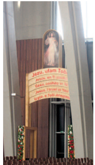
Brama Miłosierdzia z zeszłorocznych Świątowych Dni Młodzieży w Krakowie