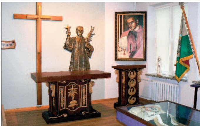
Suchowola. Izba Pamięci ks. Jerzego Popiełuszki