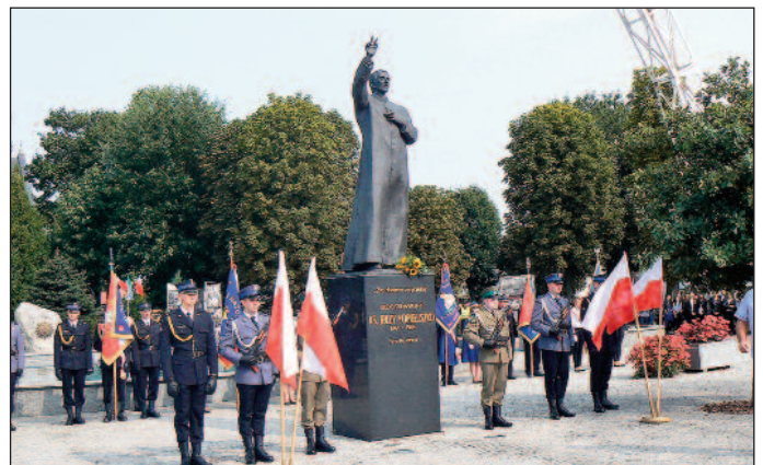
Suchowola. Uroczystości przy pomniku bł. ks. Jerzego Popiełuszki