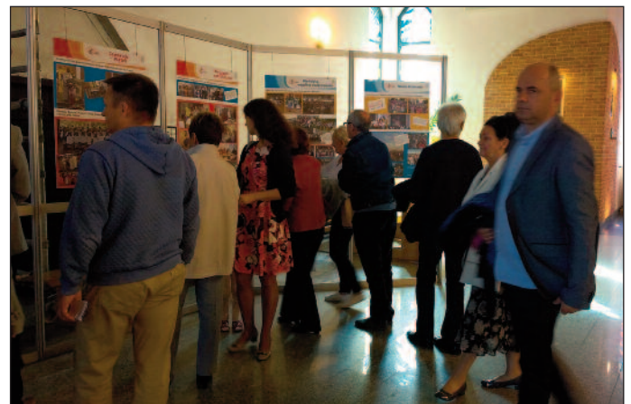
Wystawa fotograficzna poświęcona wydarzeniom diecezjalnym Świątowych Dni Młodzieży w naszej parafii