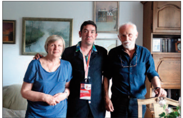
Wizytacje wolontariuszy w rodzinach przed przyjazdem pielgrzymów