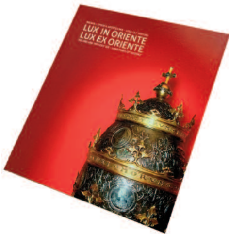
Okładka katalogu wystawy „Lux in Oriente - Lux ex Oriente”

Tytułowe Lux in Oriente (Światło na Wschodzie) odnosi się do wydarzeń sprzed ponad tysiąca lat, kiedy Książę Mieszko I przyjął chrześcijaństwo i wzmocnił struktury tworzącej się polskiej państwowości. Przez chrzest weszliśmy do wspólnoty europejskiej zbudowanej na fundamencie wiary i jurysdykcji. Lux ex Oriente (Światło ze Wschodu) oznacza wielowiekową historię działalności ewangelizacyjnej polskiego kościoła. Byliśmy przyczółkiem chrześcijaństwa na Wschodzie. Nasi królowie i hetmani toczyli walki w obronie wiary, nasi misjonarze dotarli na krańce świata głosząc Dobrą Nowinę a papież św. Jan Paweł II wprowadził Kościół w trzecie tysiąclecie.