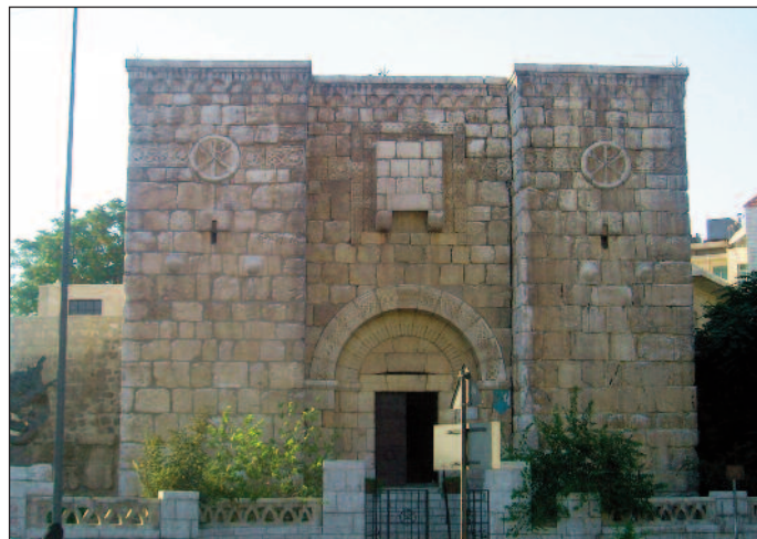
Bab Kisan, miejsce, w którym Paweł uciekał z Damaszku