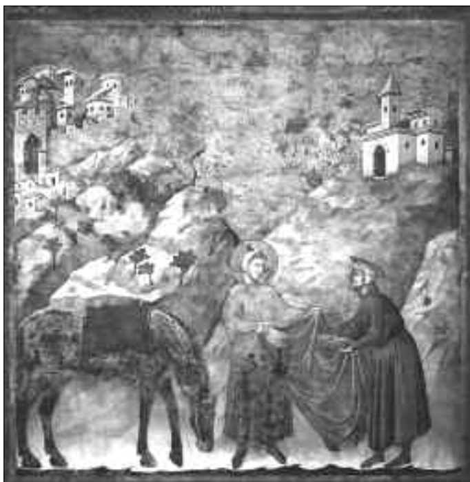
Scena z życia św. Franciszka Fresk Giotta (270 x 230 cm) w Bazylice w Asyżu