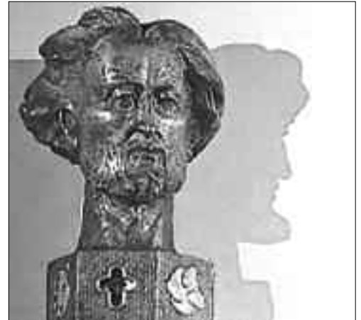
Relikwiarz św. Brata Alberta z kościoła środowisk twórczych w Warszawie ( www.dst.mkw.pl )