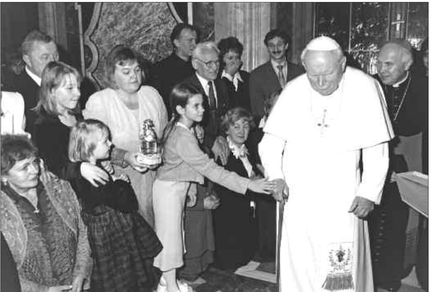
Pielgrzymka do Rzymu, audiencja prywatna w Sali Klementyńskiej w 1998 r.