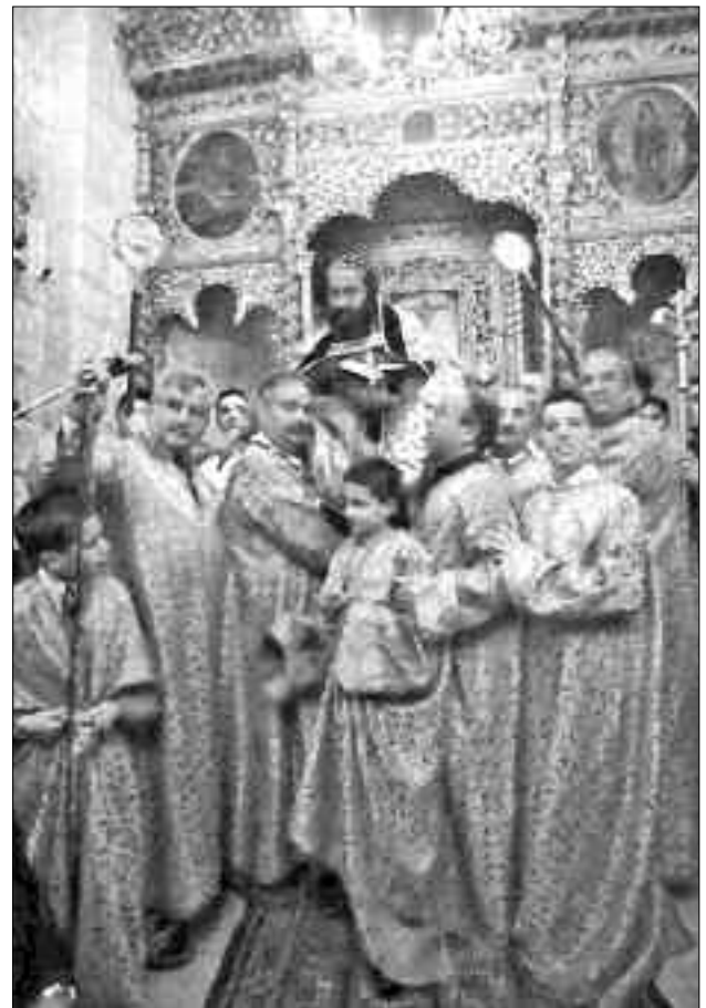
Obrzędy Bożego Ciała w syryjskim kościele w Jerozolimie.