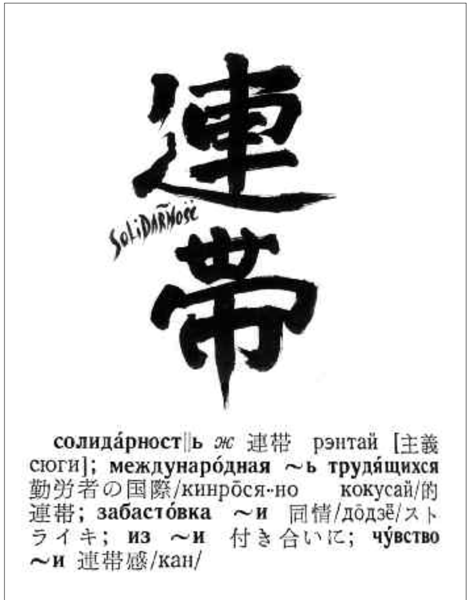
Słowo „solidarność” zapisana po japońsku i rosyjsku, za słownikiem rosyjsko-japońskim wydanym w Moskwie w 1988 r.