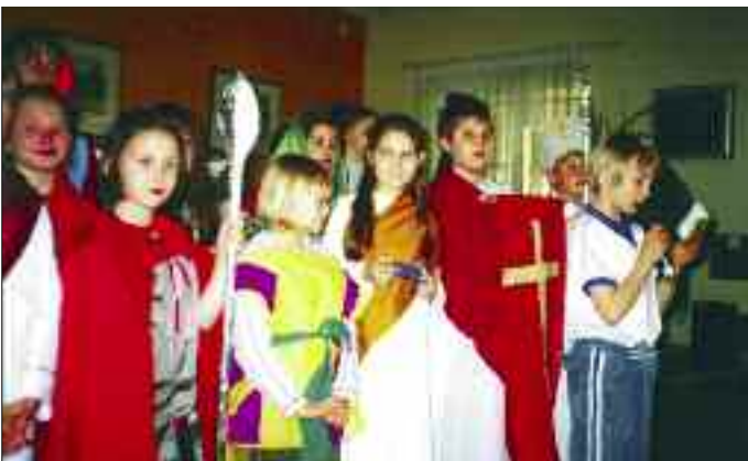
Przedstawienie w Domu Seniora