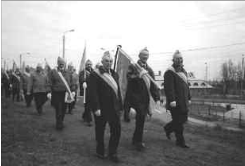
Poczet sztandarowy K.S.M. „Semper Fidelis” naszej parafii.

Mieszkańcy Pomorza Gdańskiego czczą pamięć św. Wojciecha – patrona Polski i patrona Gdańska, uczestnicząc w uroczystościach odpustowych jakie corocznie odbywają się w sanktuarium tego Świętego w Gdańsku – Świętym Wojciechu. Tegoroczne centralne uroczystości rozpoczęły się 24. kwietnia o godz. 9.00 w Bazylice Mariackiej w Gdańsku, skąd już po raz 16. wyruszyła piesza pielgrzymka wspólnoty braci Kościelnej Służby Mężczyzn „Semper Fidelis” na Wzgórze Wojciechowe – miejsce sprawowania Eucharystii.