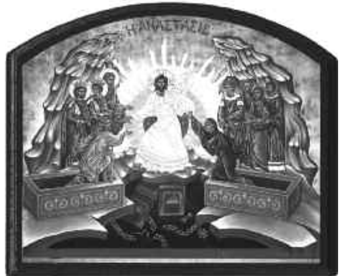
„Zmartwychwstanie”, obraz z kaplicy namalowany przez młodzież ze wspólnoty.

W Cenacolo nie korzysta się z leków farmakologicznych ani ze środków, zastępujących narkotyki. Prawdziwy lek to Anioł Stróż. Jest to osoba (chłopak lub dziewczyna, to zależy, czy jest to Dom Żeński czy Męski), która co najmniej od kilku miesięcy przebywa we wspólnocie. Jego za-