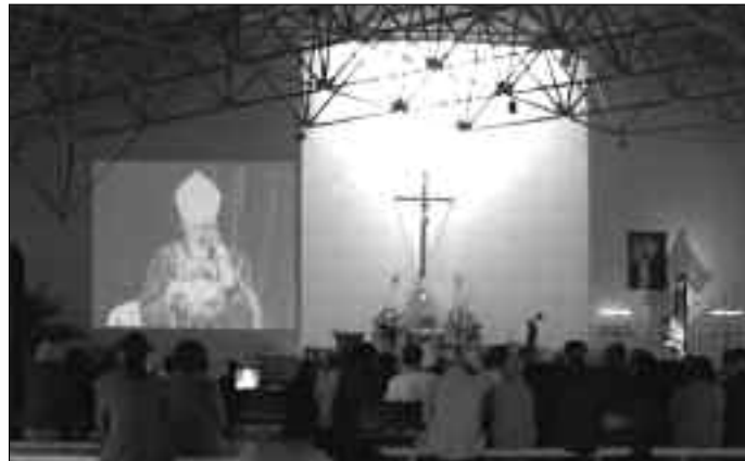
Msza św. pogrzebowa Jana Pawła II, wspólnie przeżywana w naszym kościele.

5. Próby. Kongregacja wyznacza tzw. advocatus diaboli , czyli oso-