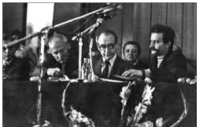
Zdjęcia z Sierpnia '80 ze zbiorów prywatnych