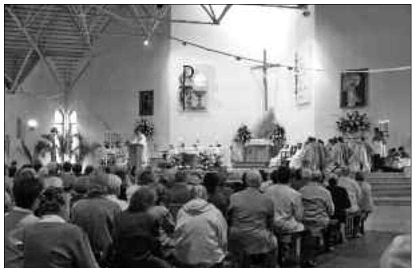
Msza św. odpustowa, 17 czerwca 2005 r.