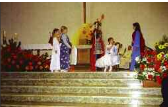
Przedstawienie „Zmartwychwstały Pan” w naszym kościele