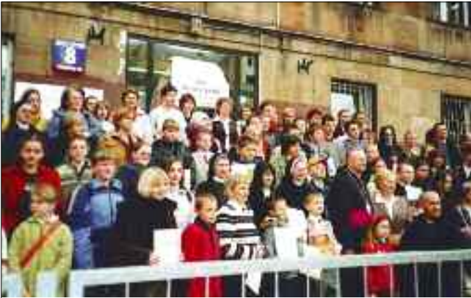
Finał Ogólnopolskiego Konkursu „Rok Eucharystii”, Warszawa, 23 kwietnia 2005 r.