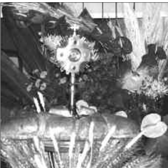
Relikwiarz św. Brata Alberta w naszej parafii