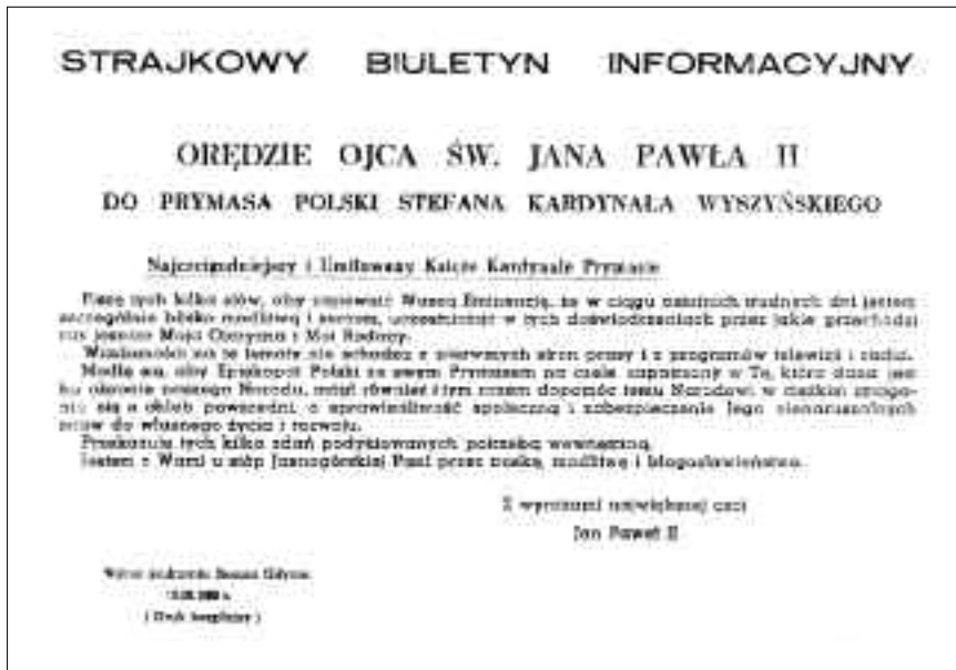
Ulotka strajkowa z Orędziem Jana Pawła II