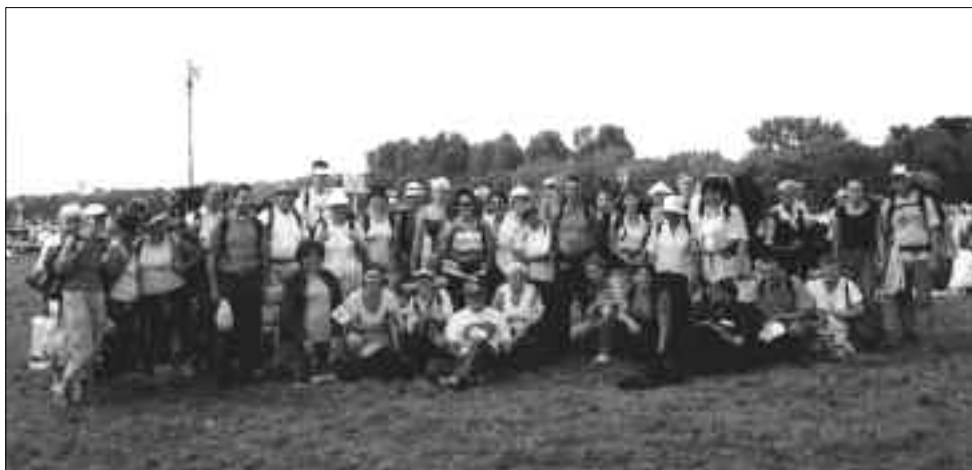
Pielgrzymi z naszej parafii na Błoniach Krakowskich po Mszy św., celebrowanej przez Ojca Św. w 2002 r.

Kolejna wizyta, w której dane mi było aktywnie uczest-