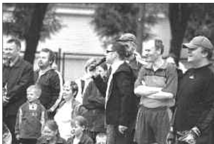
Bramkarz i inni