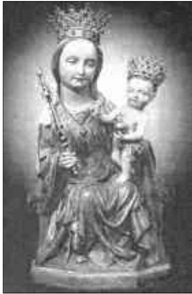
Cudowna figura Matki Boskiej Sianowskiej, Królowej Kaszub, za www.belgrau.republika.pl

Każdego roku w miesiącu lipcu i wrześniu przypada odpust w kościele parafialnym w Sianowie, który gromadzi rzesze wdzięcznych wyznawców i miłośników kultu Matki Najświętszej.