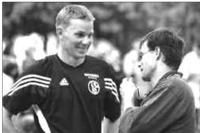
Sędzia i Mistrz