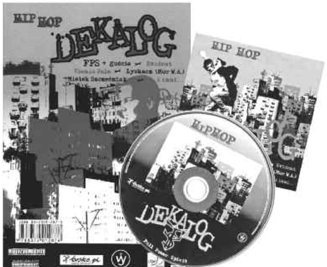
„Dekalog w sieci“, książka i płyta – Wydawnictwo Salezjańskie, Warszawa 2004 r.