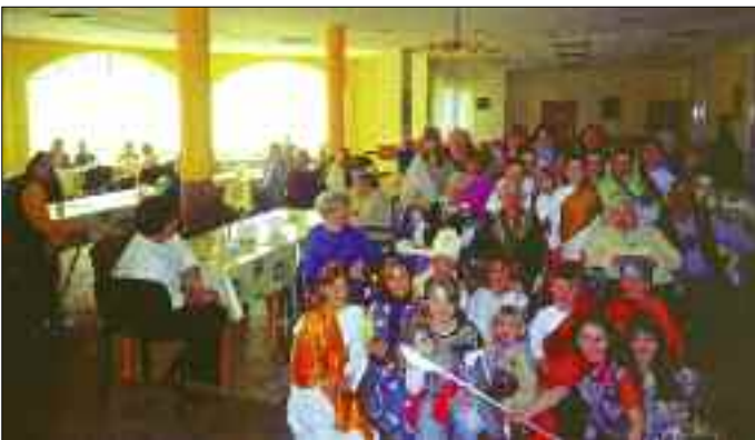
Eucharystyczny Ruch Młodych (ERM) z przedstawieniem w Domu Seniora