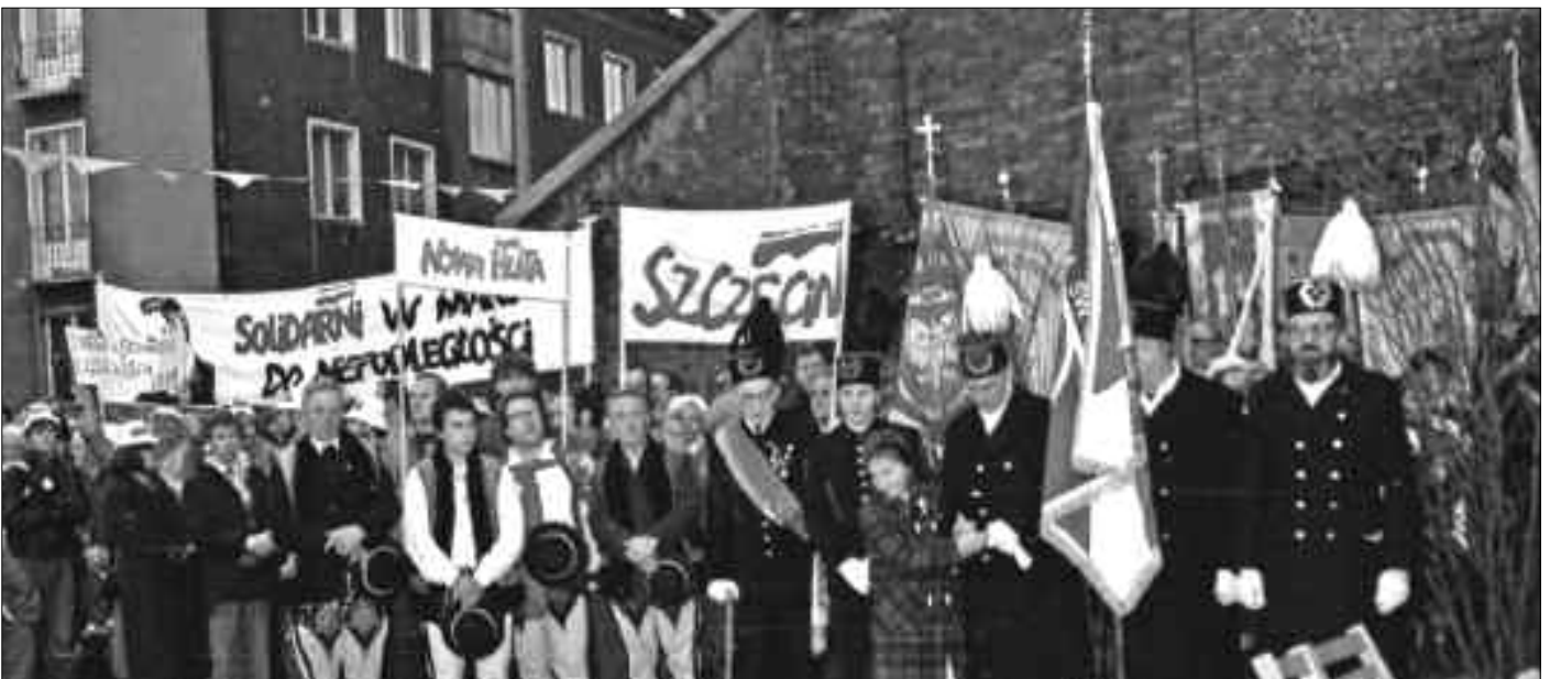
„Solidarni w marszu do Niepodległości” – z takimi hasłami zbierali się członkowie „Solidarności” z całej Polski przed pomnikiem w Gdańsku, czcząc pamięć ofiar Grudnia ‘70 r.

na podstawie książki „Pamięć i Tożsamość”