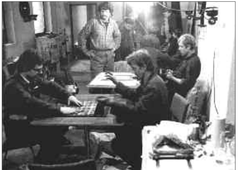
Drukarnia w stoczni gdańskiej, za „Dni tworzyli - Solidarność“ fot. Zbigniew Trybek

domościami, wiadomościami wierszami, z piosenkami. Te piosenki stały się potem przebojami, i niektóre do dziś można przy okazji usłyszeć, np. „Nie mam teraz czasu dla Ciebie” (piosenka dla córki). To wszystko tworzyło się na „gorąco”, natychmiast było powielane w prymitywnej stoczniowej drukarni i rozdawane ludziom. Przygotowane były też teksty do wysyłki w teren: do Gdyni, do Tczewa, do innych zakładów. Jak wyglądało to drukowanie, miałam okazję szczęśliwie zobaczyć. Pewnego dnia ludzie tuż przy bramie (po stoczniowej stronie) rozmawiali, że w drukarni brakuje oleju słonecznikowego. Spytałam tylko, czy dobrze usłyszałam, i natychmiast wyruszyłam do miasta. Weszłam do pierwszego z brzegu sklepu. Był to SAM, w którym były puste półki, a cały personel wyraźnie się nudził. Podeszłam