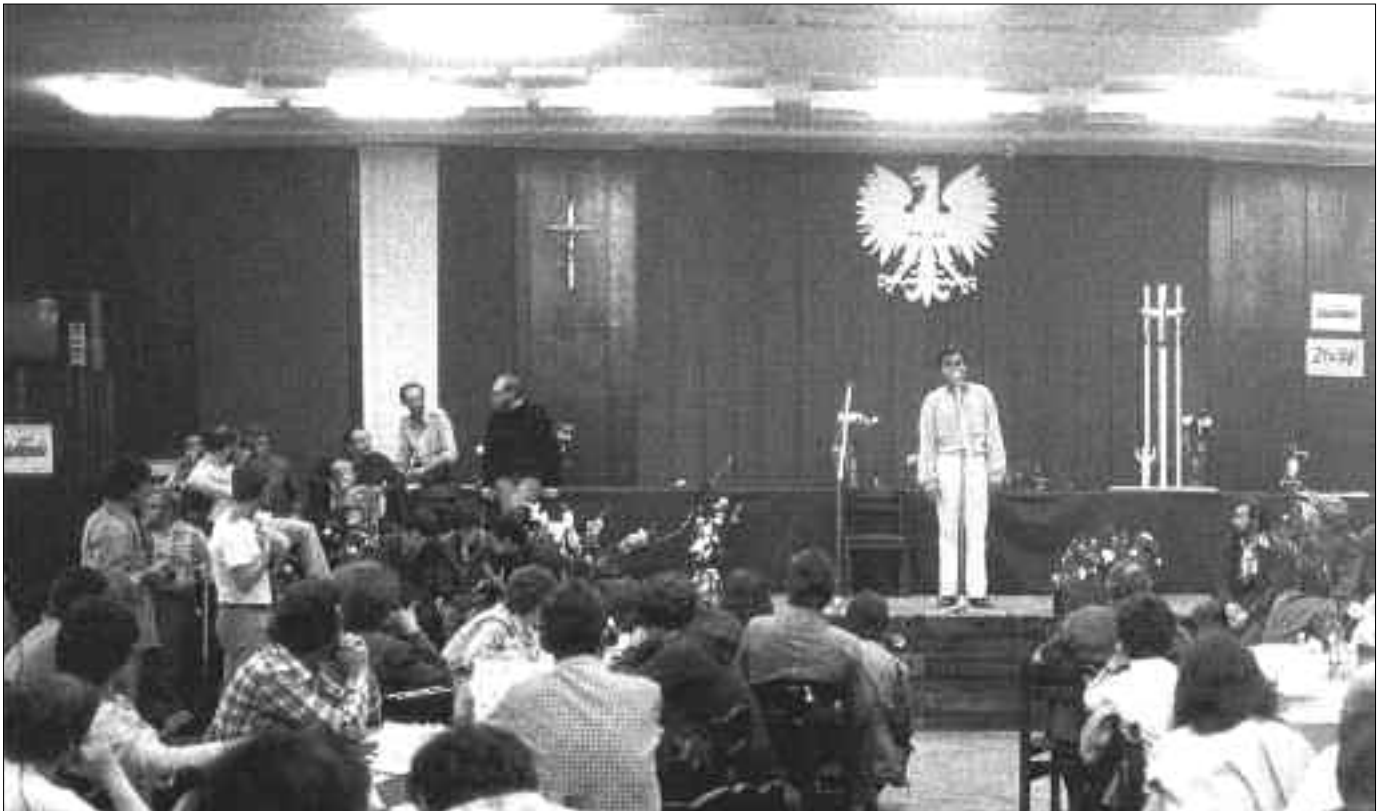
Obrady w sali BHP Stoczni Gdańskiej, za „Dni tworzyli - Solidarność”