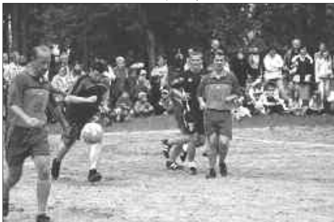
Będzie gol ?