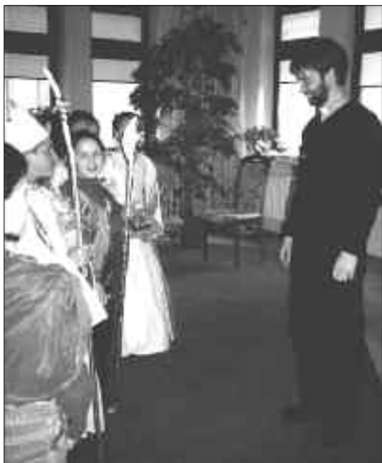
Dzieci z ERM składają życzenia imieninowe Ks. Proboszczowi