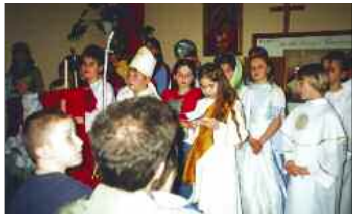
ERM-ici przedstawiają dla Rodziców i najbliższych