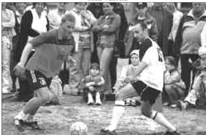
Walka o piłkę