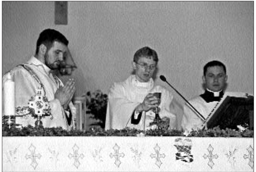
Msza Św. prymicyjna