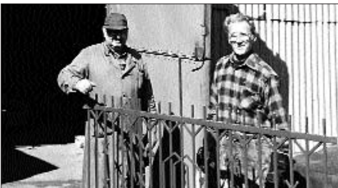
Malowanie przęseł ogrodzenia

A zatem dzięki naszemu wspólnemu wysiłkowi ko-ściół oraz jego otoczenie pięknieje radując oczy i serca nas wszystkich.