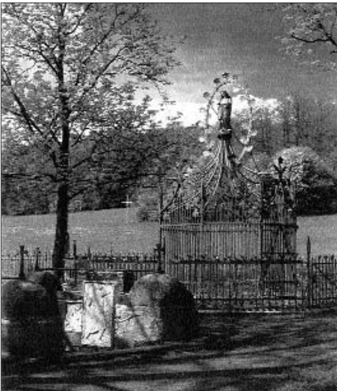
Źródełko z cudowną wodą przy Sanktuarium w Gietrzwałdzie