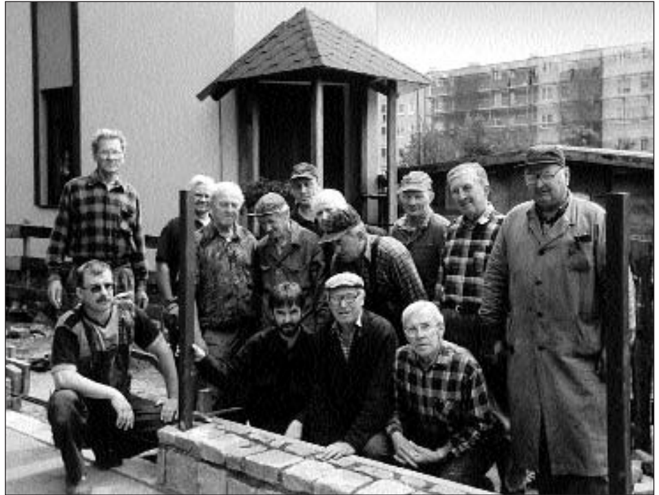
Parafianie z Ks. Proboszczem przy budowie ogrodzenia

Dzieląc się radościami, mamy świadomość, iż to wszystko, co czynimy, jest możliwe dzięki życzliwości i wsparciu materialnemu Parafian. Wyrażamy więc wdzięczność. Dziękujemy także za wyrozumiałość i wiele ciepłych słów świadczących o akceptacji naszych działań. Słowa szczególnego podziękowania kierujemy do Rady Nadzor-czej Spółdzielni, Zarządu SM Przymorze, Rady Osiedla Nr 1 oraz do Kierownictwa i Pracowników Administracji za ma-terialne wsparcie i bardzo dobrą współpracę. Dyrekcji GPEC dziękujemy za pomoc przy realizacji parkingu.