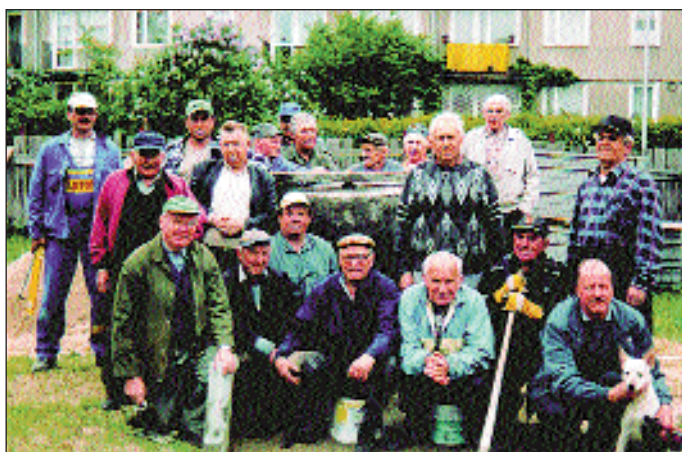
Grupa osób pracująca przy ogrodzeniu