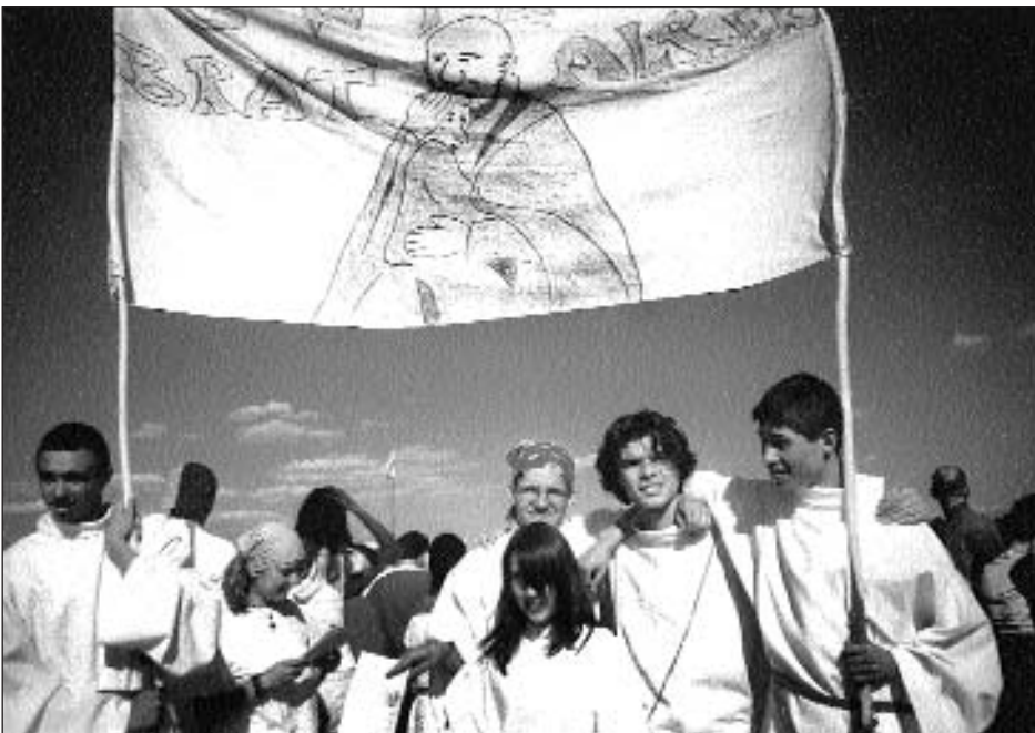
Młodzież z wizerunkiem Św. Brata Alberta

nach i grzechotkach. Gdy nasza sieć była już rozwinięta, księża zaczęli spowiadać.