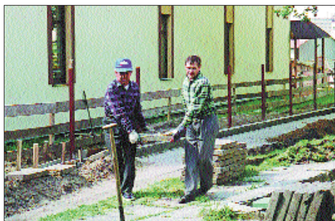
Zdejmowanie starych płyt chodnikowych