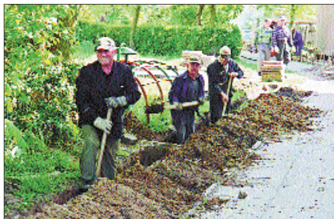
Wykonanie wykopów pod fundamenty