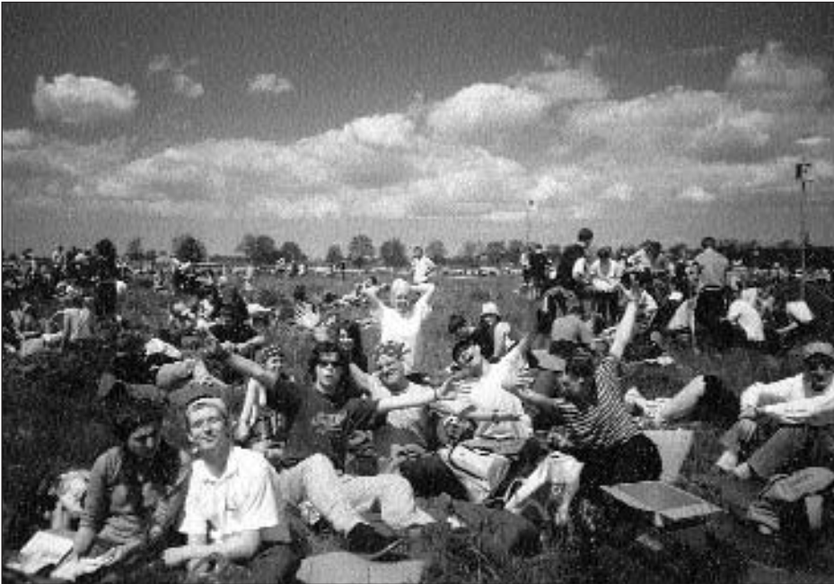
Młodzież z naszej parafii na Lednicy

Byliśmy dość blisko Ryby-Bramy i dużego ekranu, z którego przemawiał do nas Ojciec Święty. Nie od tego jednak zależało to, że przeżyłam czas lednickiego czuwania inaczej niż cztery lata temu, gdy byłam tam po raz pierwszy.