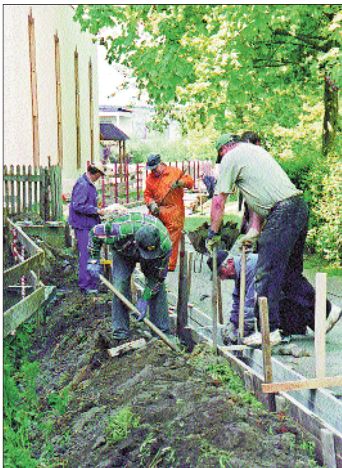
Wylewanie fundamentów ogrodzenia