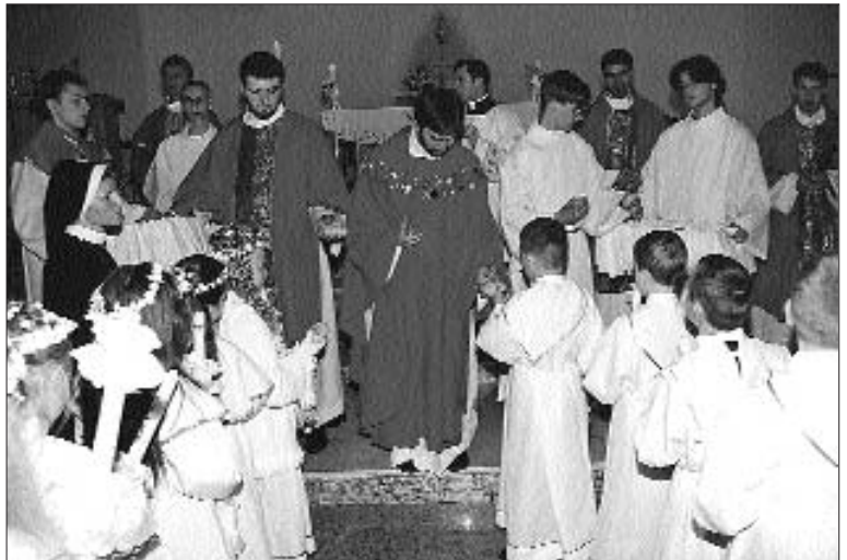
Ks. Proboszcz rozdaje chlebki św. Brata Alberta