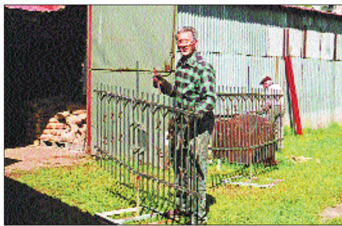
Malowanie elementów przęseł ogrodzenia