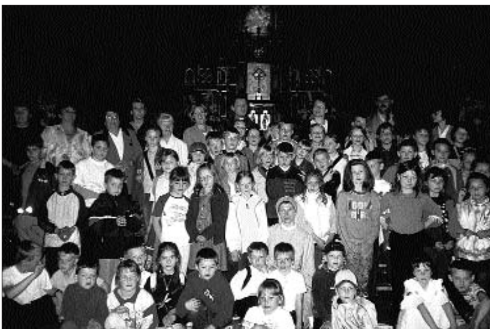
Dzieci i opiekunowie z naszej parafii na pielgrzymce w Gietrzwałdzie