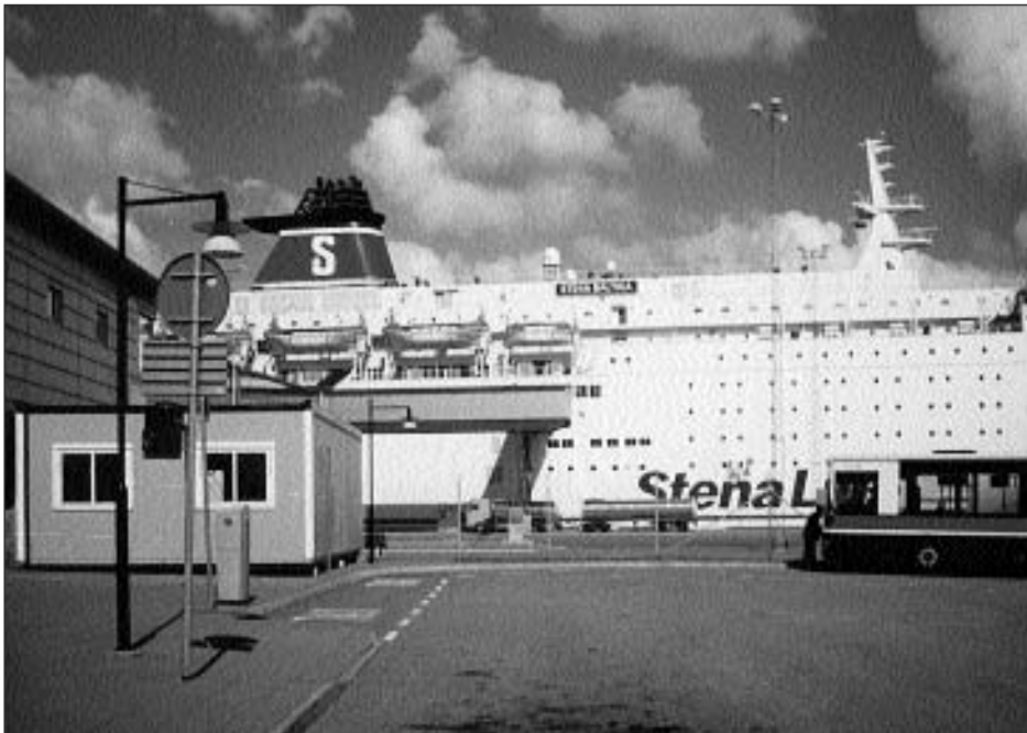
Prom przy nabrzeżu Karlskrony

a jednocześnie z rozmachem. Zajmuje kilka kondygnacji. Jest tam też restauracja, a raczej ogromny bar szybkiej obsługi, sala konferencyjna i sklep z akcesoriami morskimi. Kościół jest oczywiście protestancki (luteranski) i zabytkowy. Na ołtarzu jest krzyż, a po bokach tablice z cyframi. Te cyfry to numery niektórych psalmów – najczęściej śpiewanych. Na jednej ze ścian wisi portret Marcina Lutra. Gdy przewodniczka powiedziała, że jest to taki sam kościół jak katolicki, tylko o trochę innym charakterze – głośno powiedziałam, że „tu nie ma tabernakulum”. Powtórzyłam to dwukrotnie, żeby do wszystkich dotarło, – czym tak na-