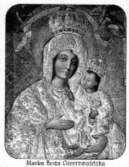
Matka Boża Gietrzwałdzka

W Sanktuarium Matki Bożej poczułem spokój, patrząc na obraz Matki Bożej, rozmyślałem o Jezusie, że Był i Jest tak dobry dla nas dzięki swej Matce. Bo Ona nas, ludzi, umiłowała, ukazując się i ostrzegając nas przed złem, nakazała ludziom, by byli dobrzy dla siebie tak, jak Jej Syn, Jezus, jest miłosierny i dobry dla nas.