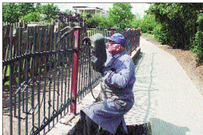
Spawanie daszków do słupków