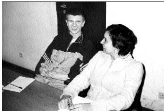
Autorzy wspomnień na katechezie przed bierzmowaniem