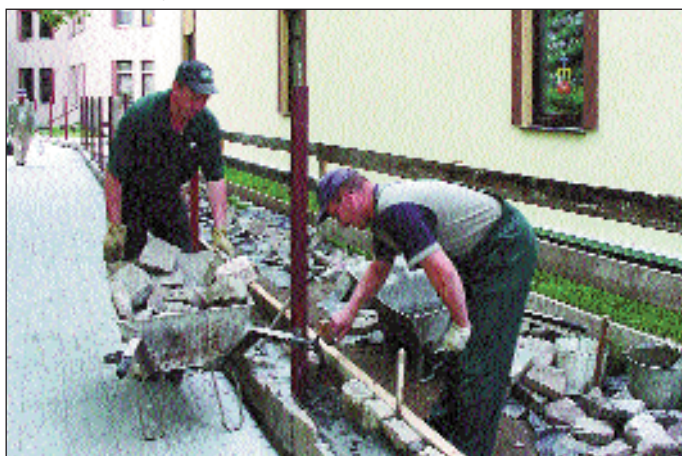
Okładanie cokołu kamieniem