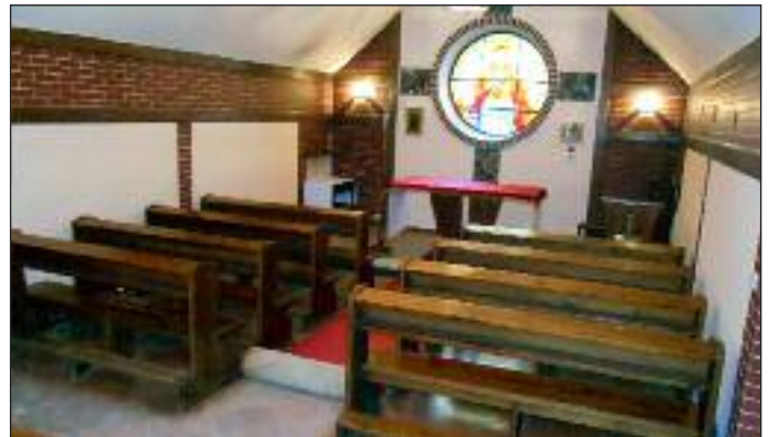
Mała kaplica seminaryjna