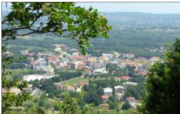
Widok na Medjugorje z góry