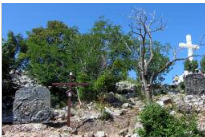
Krzyż na szczycie góry Križevac