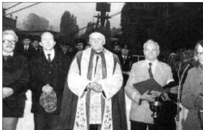
Msza św. odprawiona przez ks. prałata na terenie stoczni w 1981 r.