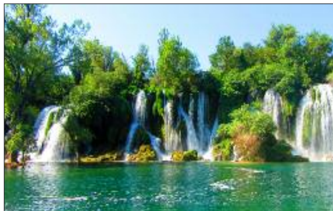
Wodospady Kravice (Bośnia)