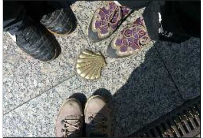
Szlak pielgrzymkowy do katedry w Santiago de Compostela, zwany „Drogą św. Jakuba”, oznaczony jest muszlami św. Jakuba.

busowy, co chyba najbardziej nas zaskoczyło. Mijaliśmy małe wioski, opuszczone domy, ale i dość duże miasteczka. Codziennie po drodze przechodziliśmy koło kilku kapliczek i kościółków, ale zawsze niestety były zamknięte, otwierane są tylko na czas Mszy Świętej albo różnego rodzaju nabożeństw. Zawsze jak była okazja, uczestniczyliśmy w Eucharystii.