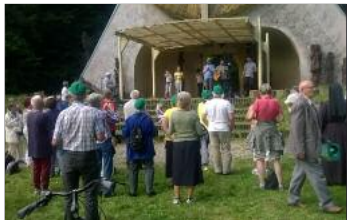
Spotkanie Duszpasterstwa Akademickiego „Lux Cordis” z autostopowiczami, którzy pojechali do Rzymu na kanonizację Jana Pawła II.