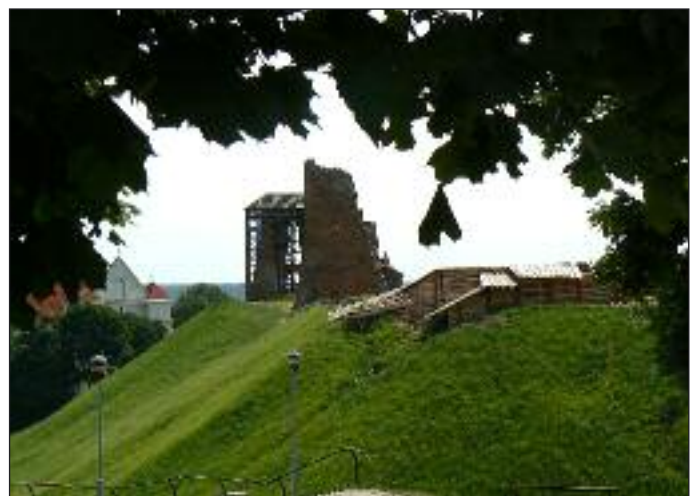
Ruiny zamku Mendoga, w tle widnieje nowogródzka fara – kościół pw. Przemienienia Pańskiego

Na podstawie materiałów zamieszczonych w Internecie opracował Stanisław Mazurek