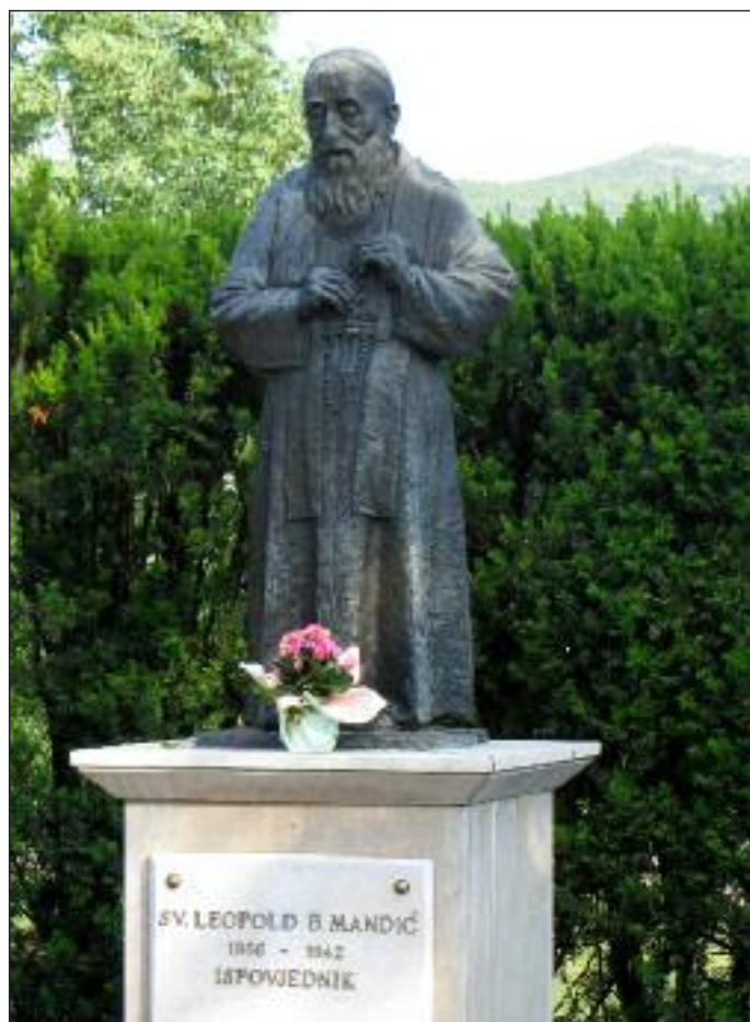
Figura św. Leopolda