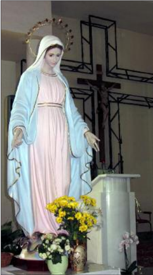
Matka Boska z kościoła w Tihalinie

Dzisiaj, w dobie coraz częstszych prześladowań chrześcijan i zagrożenia pokoju na całym już niemal świecie, wiele osób wierzących kieruje swoje kroki do bośniackiego Medjugorje, gdzie Matka Boska objawiła się po raz pierwszy 25 czerwca 1981 sześciu młodym mieszkańcom tej miejscowości, przekazując im orędzie pokoju Swojego Syna.