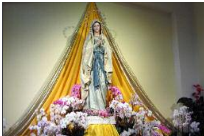
Matka Boska z kościoła w Medjugorje