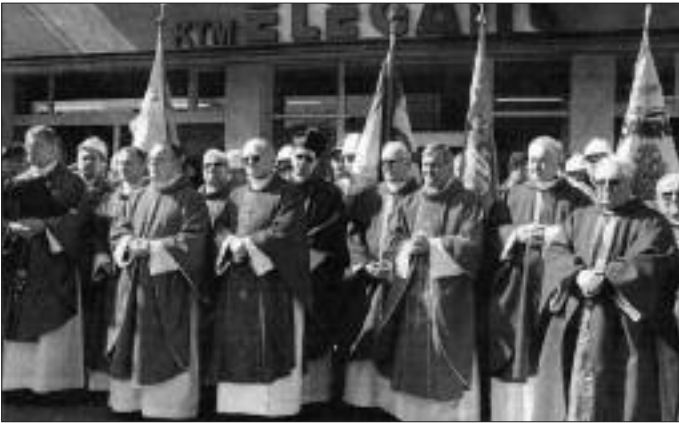
Gdynia. Przed uroczystością umurowania kamienia węgielnego pod budowę pomnika ks. prałata Hilarego Jastaka.