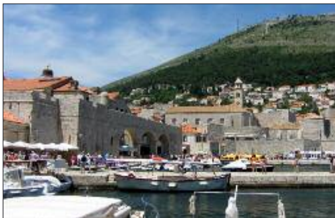
Dubrownik - perła Adriatyku (Chorwacja)