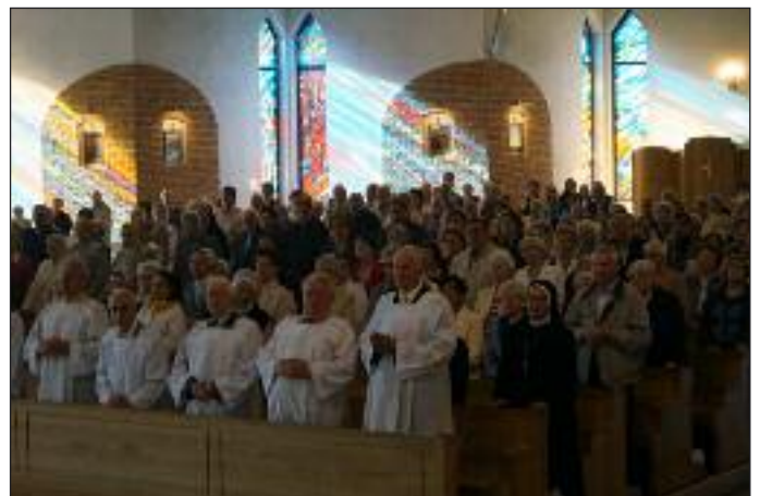
Ksiądz abp Tadeusz Gocłowski poświęcił nowy relikwiarz i kielich przed Mszą św. odpustową