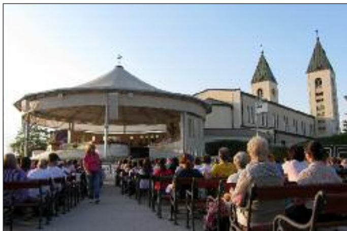
Msza św. w Medjugorje