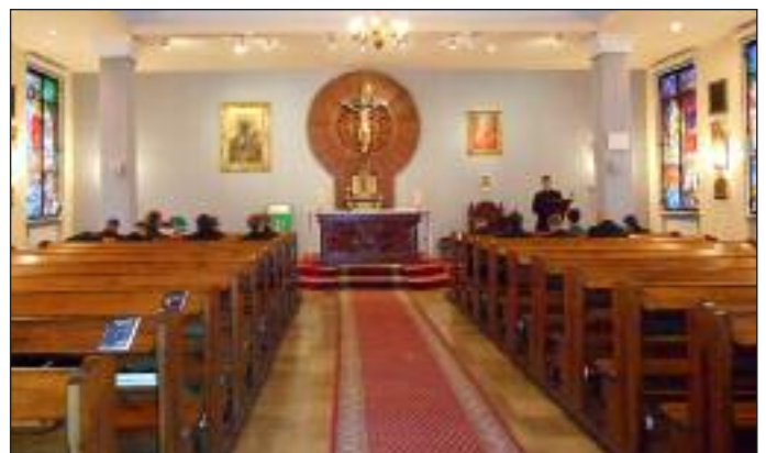
Duża kaplica seminaryjna