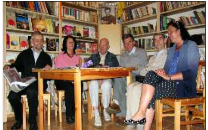
Spotkanie zespołu redakcyjnego Głosu Brata w bibliotece parafialnej w 2012 roku

Ps. Niestety jednak pismo nasze nie dociera do parafian obojętnych religijnie i nieobecnych w kościele.