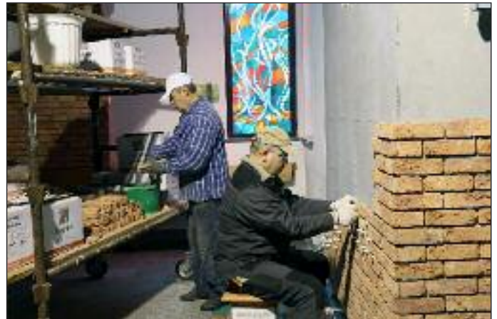
Budowanie ścianek ceglanych pod stację Drogi Krzyżowej