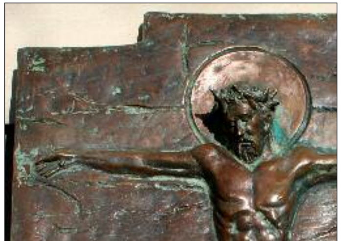
Prace rzeźbiarskie nad XII stacją Drogi Krzyżowej