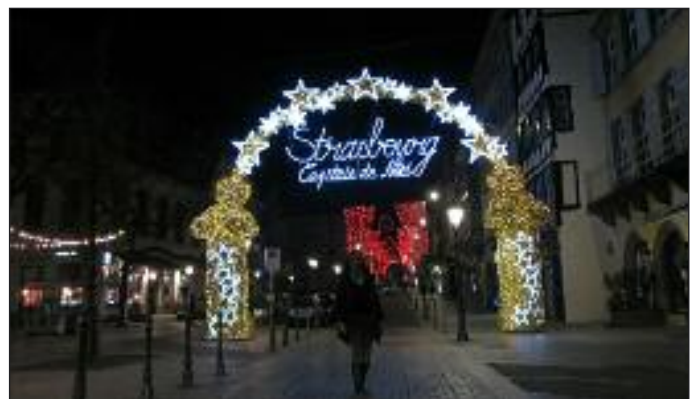
Strasbourg – francuska stolica Bożego Narodzenia