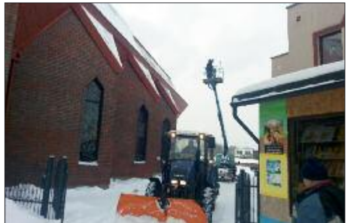
Odśnieżanie terenu parafii i dachu kościoła