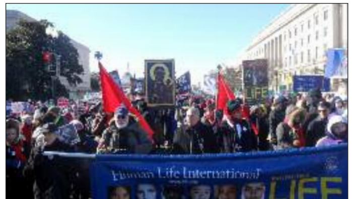
Marsz dla Życia w Waszyngtonie, 22 stycznia 2014 roku. Największy na świecie protest przeciwko aborcji.