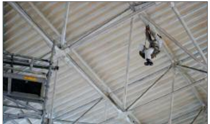
Prace inwentaryzacyjne niezbędne do wykonania dokumentacji badań nośnej konstrukcji dachowej