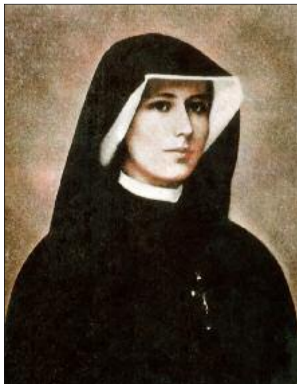
Św. Siostra Faustyna Kowalska (1905-1938)

Jako młody człowiek Karol Wojtyła w czasie drugiej wojny światowej często modlił się przy grobie siostry Faustyny, gdy szedł do pracy lub wracał z niej, w pobliskim zakładzie produkcji sody. Później jako ksiądz, następnie bi-