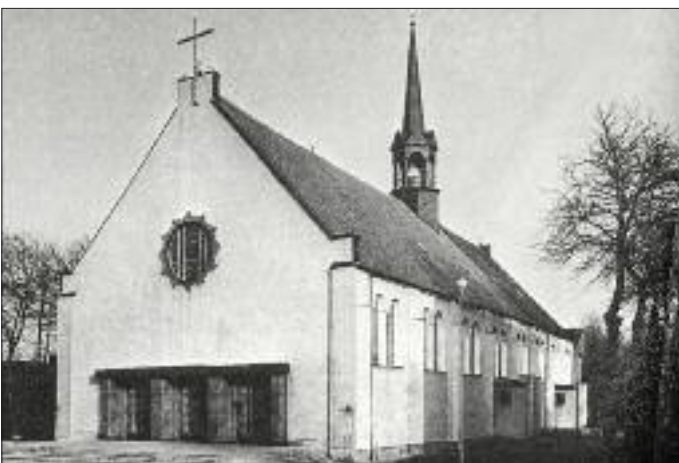
Kościół pw. św. Antoniego w Brzeźnie