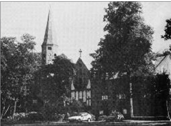
Kościół pw. N.M.P. Gwiazdy Morza w Sopocie