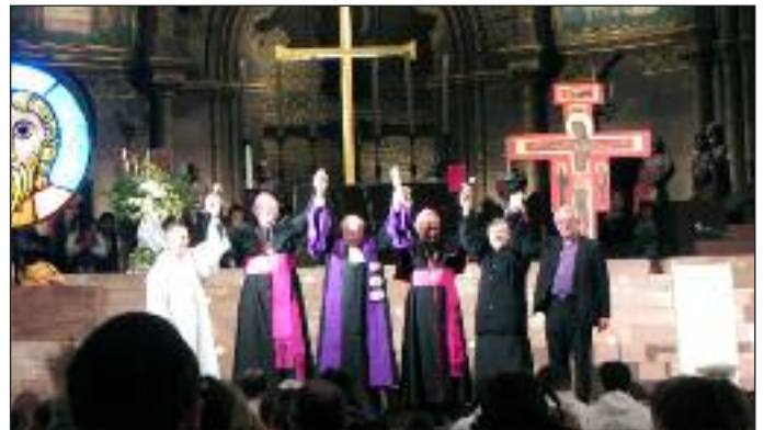
prawdziwa ekumenia (nie tylko wyznaniowa)