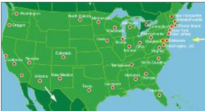
Miejsca peregrynacji Ikony w Stanach Zjednoczonych Ameryki Północnej i Kanady

Peregrynacja kopii ikony Matki Boskiej Częstochowskiej „Od Oceanu do Oceanu” trwa już dwa lata. 28 stycznia 2012 roku po uroczystościach na Jasnej Górze obraz wyruszył w świat, aby występować w obronie życia. Do dzisiaj wizerunek Matki Bożej przejechał ok. 90 tys. km, czyli pokonał drogę dwukrotnie większą od długości równika. Do wiernych trafiło ponad 250 tysięcy obrazków w 17. językach z wizerunkiem Ikony Matki Bożej. Począwszy od 1 grudnia 2013 r. obraz podróżuje po Stanach Zjednoczonych, natomiast 1 listopada br. zostanie on przekazany do Meksyku i rozpocznie wędrówkę w kierunku Ameryki Środkowej i Południowej.