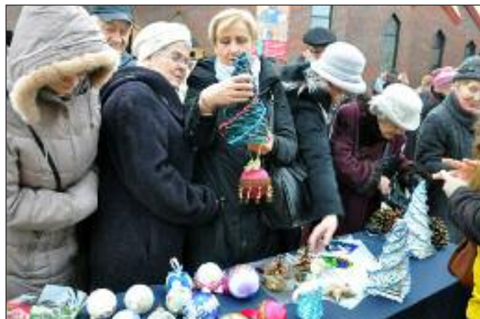
Parafianie podziwiają i kupują podczas kiermaszu małe dzieła na świąteczny stół Bożonarodzeniowy

Oczywiście nie sposób zapomnieć o gościnności księży, którzy jak zwykle zadbali o nasze dobre samopoczucie. Serdeczne rozmowy i uśmiechy, słodkości i kawy i... witraże naszych uczniów w oknach ;) za to wszystko wielkie „Bóg zapłać!”.