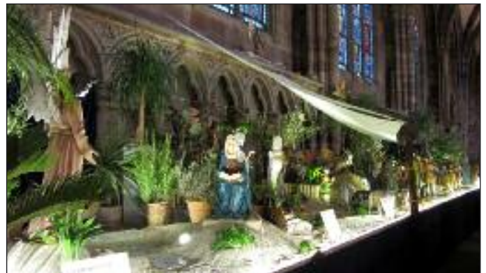
najdłuższa zapewne szopka bożonarodzeniowa