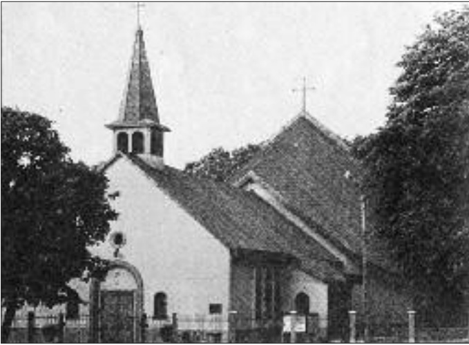
Kościół pw. św. Rodziny, Gdańsk-Stogi