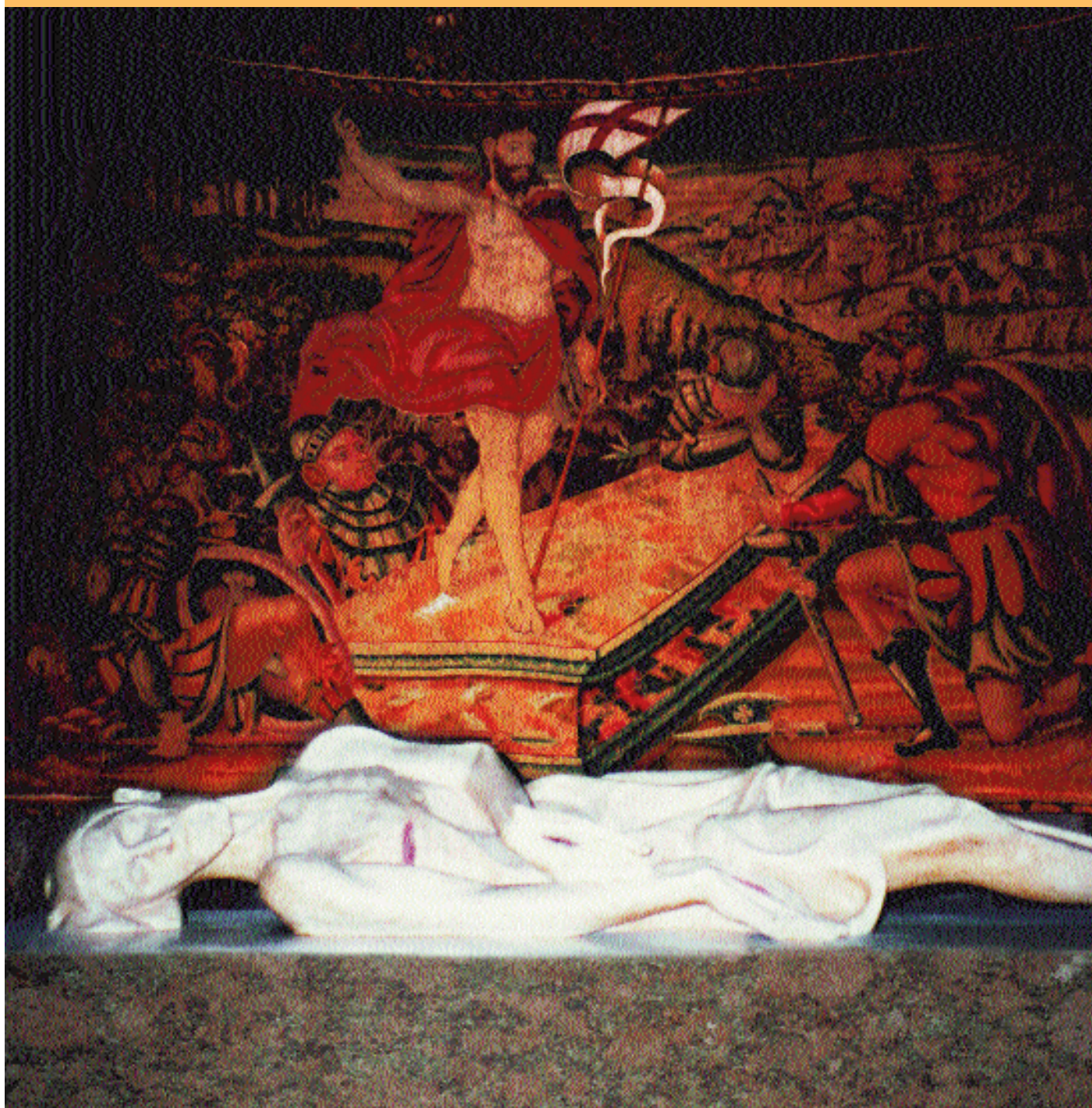
Girona, kaplica boczna Katedry