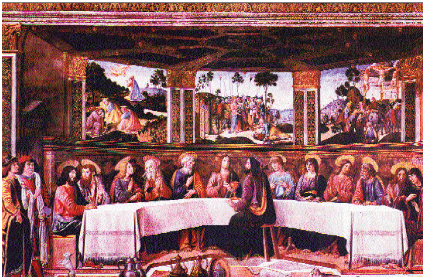
Kaplica Sykstyńska – Ostatnia wieczerza, Michał Anioł (reprodukcja z albumu „Watykan” – Plurigraf Narni ‘94)