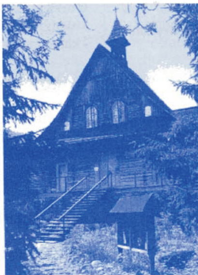
Zakopane - Kalatówki Klasztor Sióstr Albertynek