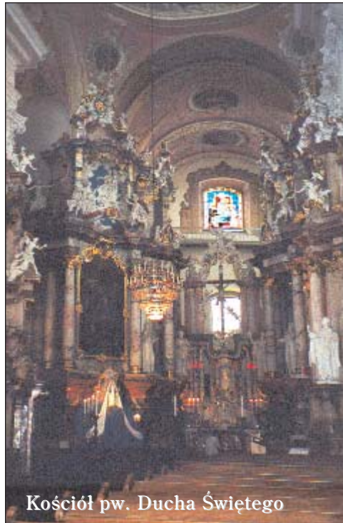
Kościół pw. Ducha Świętego