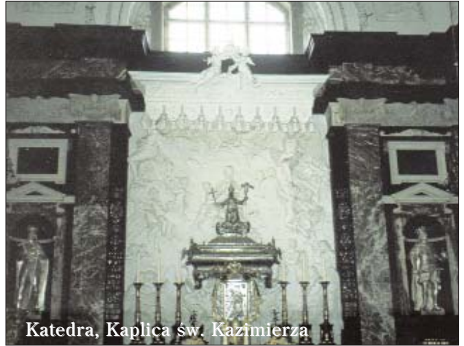
Katedra, Kaplica św. Kazimierza