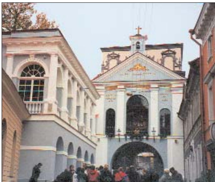
Kaplica w Ostrej Bramie