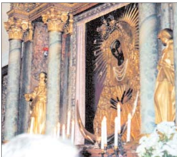
Obraz Matki Bożej Ostrobramskiej, Matki Miłosierdzia i Pokoju