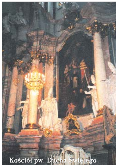
Kościół pw. Ducha Świętego