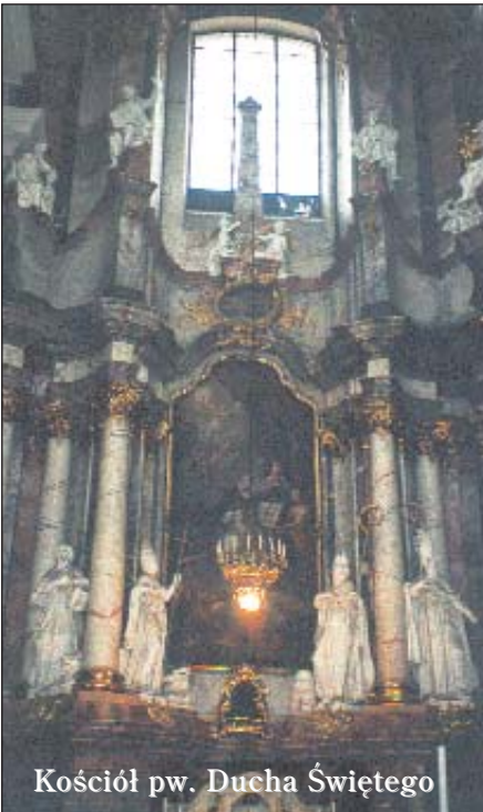
Kościół pw. Ducha Świętego