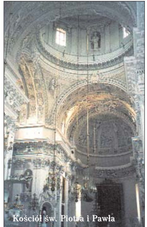
Kościół św. Piotra i Pawła