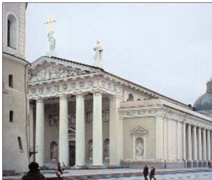
Katedra wileńska pw. św. Stanisława