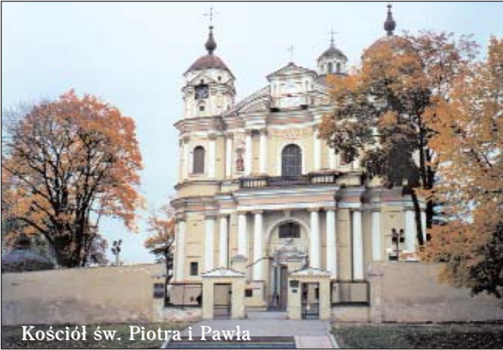
Kościół św. Piotra i Pawła