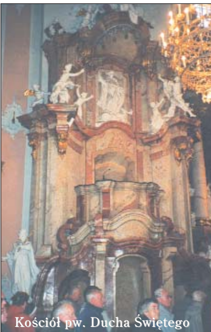
Kościół pw. Ducha Świętego